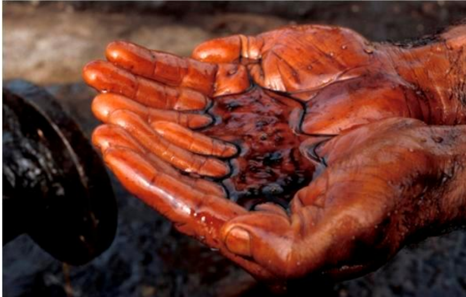
سوخت مصرفی هیتر pf super

نوع سوخت مصرفی گرماساز SUPER PF بستگی به نوع مشعلی خواهد داشت که بر روی دستگاه تعبیه شده است ، گروه صنعتی اسکندری مشعلهای گازسوز ، گازوئیل سوز و حتی دوگانه سوز را بر روی هیتر ارائه می دهد ، اما کاربرد می تواند از هر مشعلی با هر سوختی استفاده نموده و گرمایش سالن مورد نظر خود را تأمین نماید.