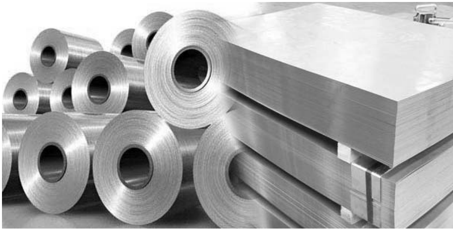
جنس کوره هیتر super pf

یکی از مهم‌ترین اجزای گرماساز کوره‌ی آن می‌باشد که در ایران بیشتر از جنس فولاد ساخته می‌شود، استفاده از فولاد به عنوان جنس کوره با استانداردهای گرمایشی مطابقت ندارد چراکه برای جنس کوره باید از جنسی استفاده شود که کاملاً نسوز بوده و یا در مقابل گرمای مشعل بسیار مقاوم باشد به همین دلیل گروه صنعتی اسکندری از جنس استیل خالص نسوز غیر مغناطیسی به جهت ساخت کوره استفاده کرده است که امکان سوراخ شدن و یا تخریب آن وجود ندارد.