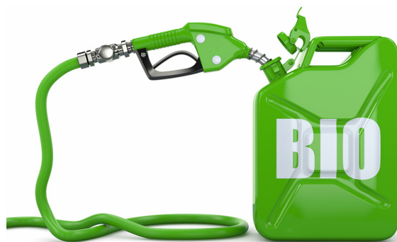
سوخت هیتر PF220000

هیتر گرمایشی PF220000 بسته به نوع مشعل میتواند از تمامی سوخت های موجود استفاده نماید به این معنا که نوع سوخت مصرفی هیتر دقیقاً رابطه مستقیم نوع مشعل دارد و این نوع مشعل مورد استفاده میباشد که تعیین کننده سوخت مصرفی است.