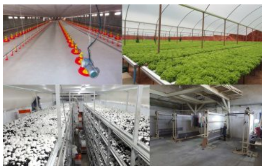
موارد مصرف هیتر PF220000

موارد مورد استفاده هیتر گلخانه ای PF 220.000 :