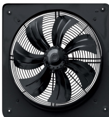
فن های دمنده هیتر PF220000

هیتر PF220000 | فن های هر هیتری رابطه مستقیم با راندمان گرماسازی هیتر دارد، به همین منظور گروه صنعتی اسکندری سعی بر این داشته تا بهترین و قوی ترین فن ها را بر روی هیتر pf220000 مورد استفاده قرار دهد، فن های تعبیه شده بر روی این محصول از نوع فن های دمنده بوده که بهترین تولید کننده فن در سطح ایران میباشد، فن های دمنده ی تعبیه شده بر روی گرماساز pf220000 وظیفه پمپاژ هوای گرم به داخل سالن را برعهده دارد دارای نشان استاندارد ملی و همچنین برچسب انرژی A میباشد.