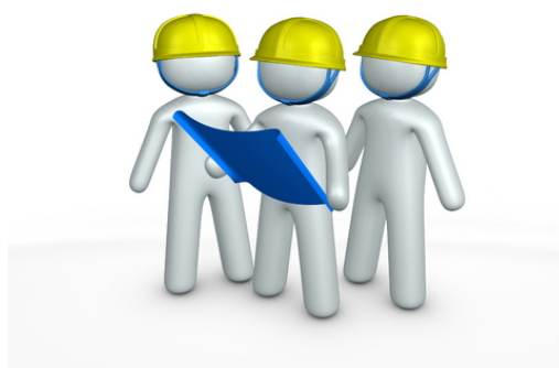
ایمنی هیتر Pf220000

هیتر PF220000 | تمامی گرماساز های تولیدی گروه صنعتی اسکندری دارای ۴ لایه ایمنی میباشد که امنیت هیتر را تا ۱۰۰ درصد تضمین مینماید. این چهار لایه به این صورت میباشد که اولین لایه فیوزهای کم آمپر میباشد که در صورت نوسان برق حتی در حد بسیار کم فیوز